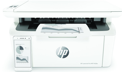
Imprimante multifonction HP LaserJet Pro M28w

Imprimante avec sécurité dynamique activée. Uniquement destinée à être utilisée avec des cartouches dotées d'une puce authentique HP. Les cartouches dotées d'une puce non HP peuvent ne pas fonctionner et celles qui fonctionnent actuellement pourraient ne plus fonctionner à l'avenir. Pour en savoir plus, consultez: